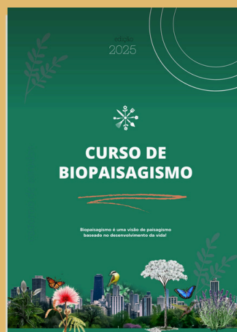
Caderno do curso