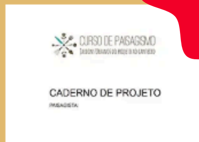
Caderno de projeto