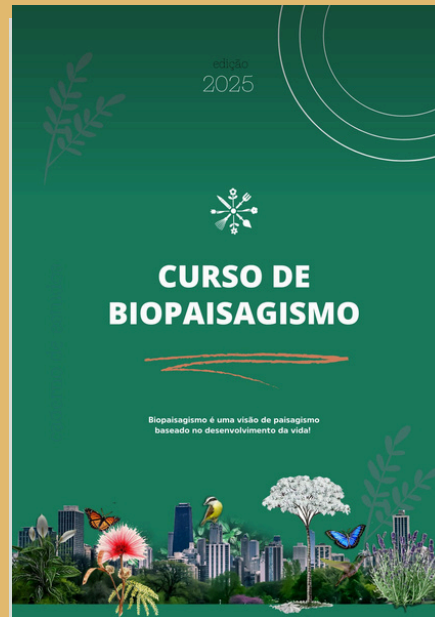
Caderno do curso

Parcelado cartão de crédito 10 x R$ 419,29 ( estudantes 10% )