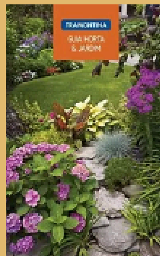
Guia de horta e jardim