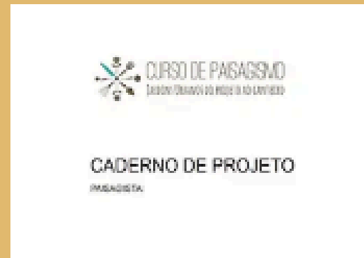
Caderno de projeto