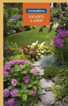
Guia de horta e jardim